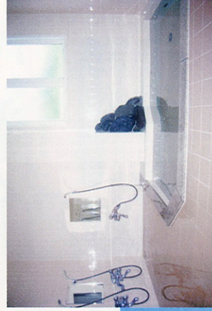
旅の疲れをゆったりお風呂でリフレッシュ。