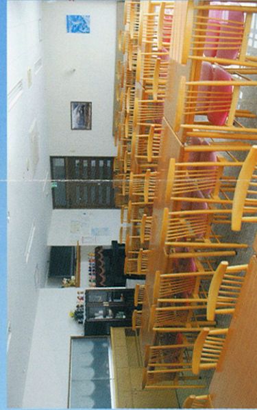
旬の幸・山の幸を手作り料理でおもてなし。