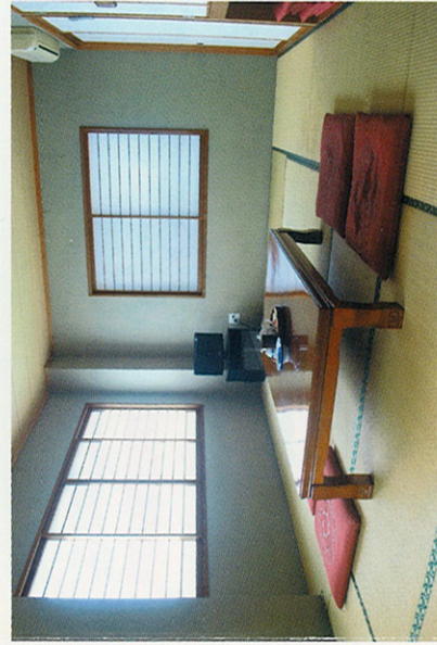
落ち着いたお部屋でのびのびとおくつろぎください。